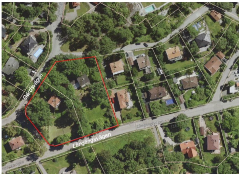
Kvarteret Ladugården sett uppifrån. Norr till vänster i bild.

Inom fastigheterna finns en höjdskillnad mellan östra och västra delen, med den högre marknivån i öster. Med bil angörs fastigheterna österifrån från Gårdsvägen. Vid en avstyckning skulle styckningslotterna få ny infart västerifrån från Långängsvägen.